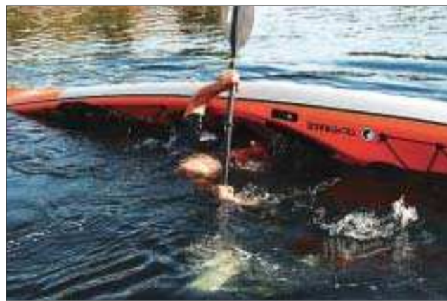
DUKKER OPP IGJEN: ...og her er han på vei opp igjen.